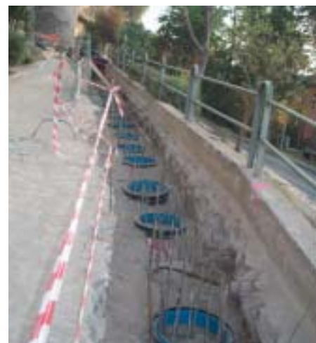
CONSOLIDAMENTO DI VIA AFRICA ORIENTALE

pubblici così faticosamente rinnovati. Agli abitanti del centro storico è invece richiesto di contribuire al mantenimento della proprietà comune evitando di gettare in strada rifiuti solidi o liquidi di qualsiasi natura, provvedendo a mantenere pulite e decorose le pertinenze esterne delle proprie abitazioni confinanti con la proprietà pubblica o da questa visibili, ecc. Per quanto riguarda