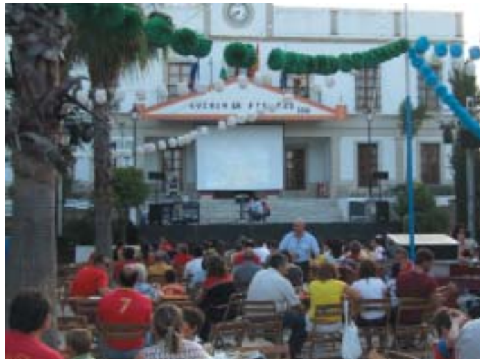
"Plaza de España" con il municipio, in un giorno di festa.

N° abitanti: 2.711 (1.390 uomini, 1.321 donne)