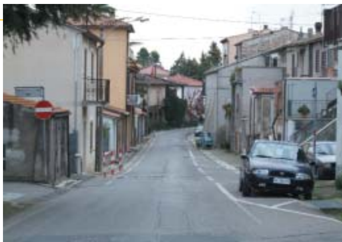
IL TRATTO DI VIA PIAVE INTERESSATO DAL PRIMO STRALCIO DEI LAVORI

entro il prossimo anno. Un discorso a parte va invece fatto per Largo Pereri e le aree circostanti su cui deve essere ancora avviata la progettazione, in attesa di individuare ulteriori possibilità di finanziamento. La nuova veste del Centro Storico comporta però un diverso e maggiore impegno per il mantenimento sia da parte dell'Amministrazione Comunale che da parte degli abitanti. L'Amministrazione dovrà fare in modo da assicurare una pulizia più attenta ed assidua di TUTTE le strade, un controllo più assiduo da parte della polizia municipale per la prevenzione, il contenimento ed il sanzionamento di quegli atti e comportamenti che possano danneggiare sia la fisicità che deturpare l'immagine dei beni